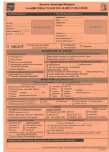
PLATE-FORME DE CYTOMETRIE EN FLUX